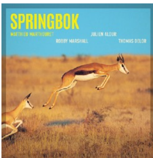
EP "SPRINGBOK" (1er Octobre 2021)