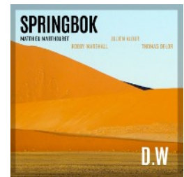
Single "D.W." (Juin 2021)

En concert le vendredi 8 octobre 2021 , 38 Riv'Jazz-Club (Paris), dans le cadre du festival JAZZ SUR SEINE .